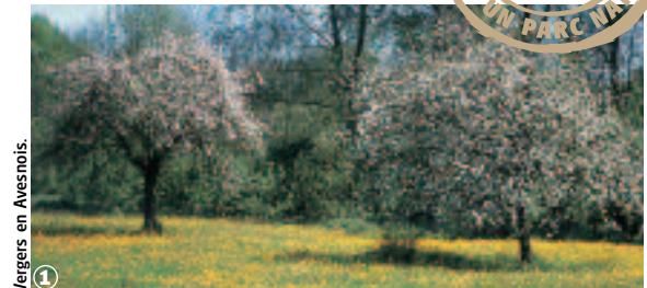
1 Vergers en Avesnois.

Randonnée Pédestre Sentier des Druides : 7 km