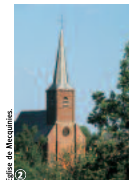
2 Eglise de Mecquignies.

En période de pluie, le port de chaussures étanches est indispensable.