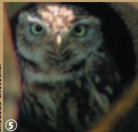
5 Chouette chevêche.