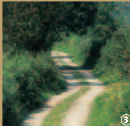
3 Chemin bocager.

Transition entre le Bavaisis et la forêt de Mormal, le paysage d'Obies